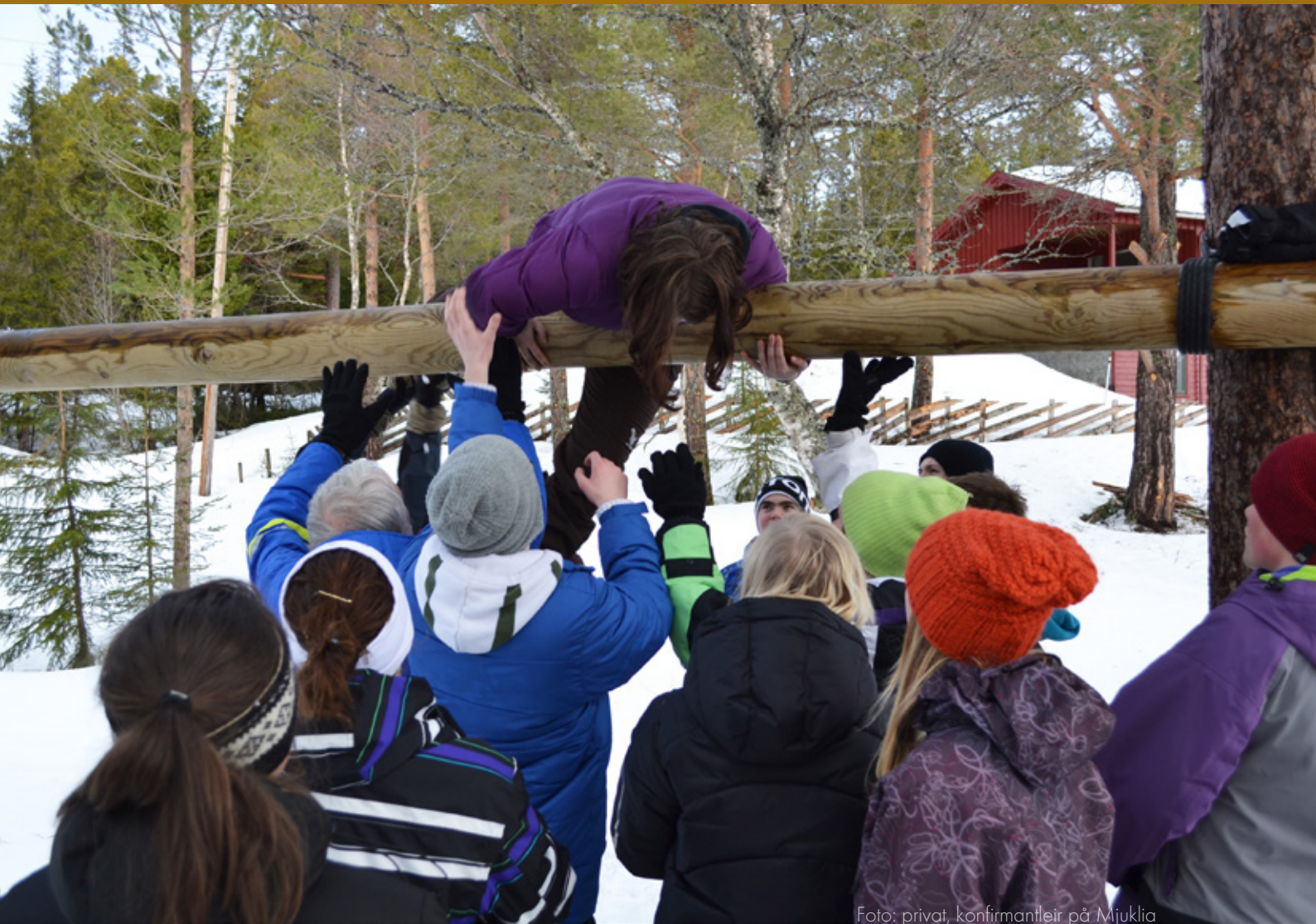
konfirmanteir på Mjúklla